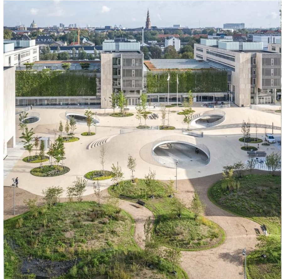
Karen Blixen park, Kodaň

https://new-european-bauhaus.europa.eu/index_en