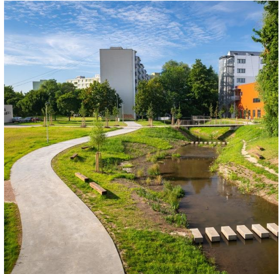
Cesta podél Staré Ponávky nad sídlištěm Komárov, Brno Ateliér Fontes

Úprava vodního toku, terénní úpravy, park, parkové cesty, lávky pro pěší, pobytové prvky, městský mobiliář a kvalitní veřejné osvětlení zpřístupnily velmi zanedbané území a umožnily příjemný pobyt u tekoucí vody. Jde o první úsek revitalizace toku a břehů Staré Ponávky, po němž budou následovat další.