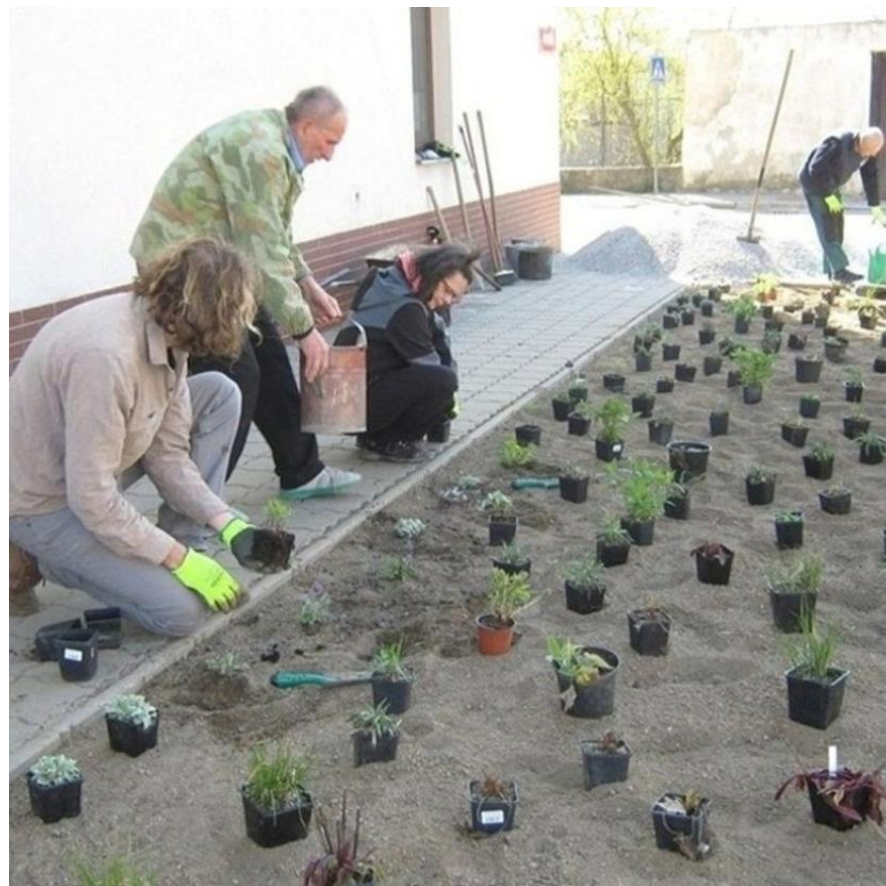
Cesta Strmilovské vody, Strmilov

Dobrovolníci z místní knihovny upravili veřejná místa po obci ideově propojená tématem vody. Na začátku projektu stálo rozhořčení nad tím, že někdo parkuje nad studnou a chuť party lidí to změnit. Obyvatelé Strmilova se zájmem o své okolí společně hledali kromě způsobů propagace ochrany vody i cesty k sobě navzájem. Chtěli oživit sousedské vztahy, zvelebit veřejná prostranství kolem studní a probudit u lidí zájem o veřejný prostor.