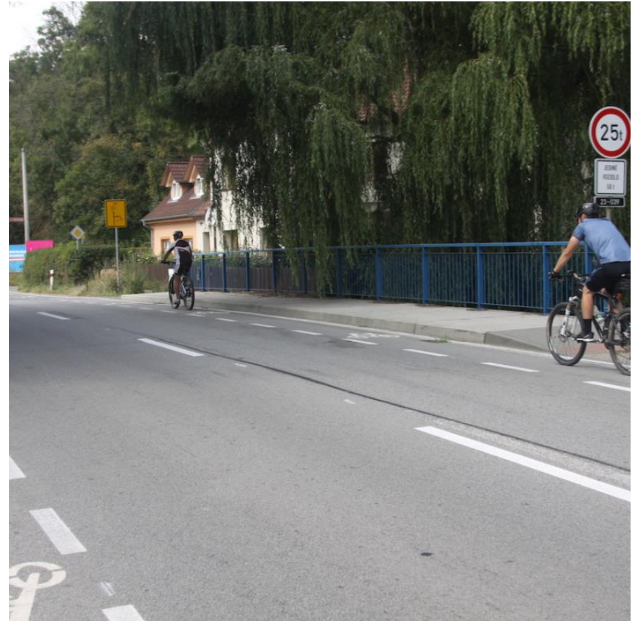
Plošná opatření pro cyklisty, Třebíč

V Třebíči se stal malý zázrak: za pouhé tři měsíce tam dostali do sedel více pravidelných cyklistů než předtím za celé roky. A navíc jim k tomu stačila realizace opatření nestavební, tedy ne příliš nákladné povahy. „Háček“ spočívá v tom, že nebyly realizovány náhodně, ale ve vzájemném propojení, které dává smysl i jako celek. A pomohla také dobře zvládnutá komunikace s veřejností.