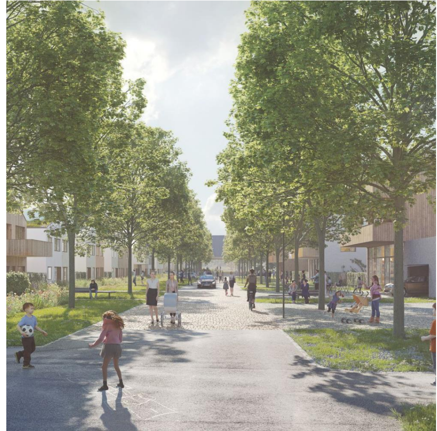
Nová „chytrá“ městská čtvrť

Architekt je vzdělán a praxí vycvičen k řešení komplexních úloh.