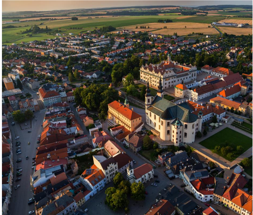
Litomyšl – městský architekt od roku 1992

Městský architekt je odborný poradce samosprávy pro koordinaci rozvoje včetně veřejného prostoru.